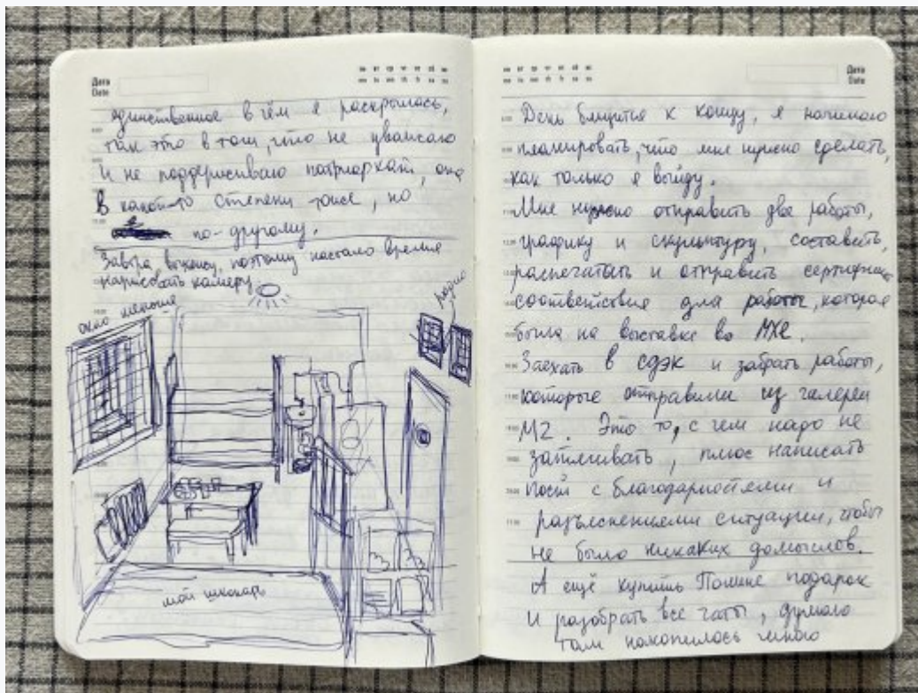
Рисунки Алисы из камеры спецприемника